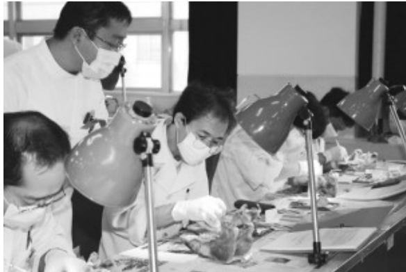
同窓会学術セミナー風景

るインストラクターの諸先生、ならびに同窓会の先生方、お忙しい中ご指導頂きましてどうもありがとうございました。