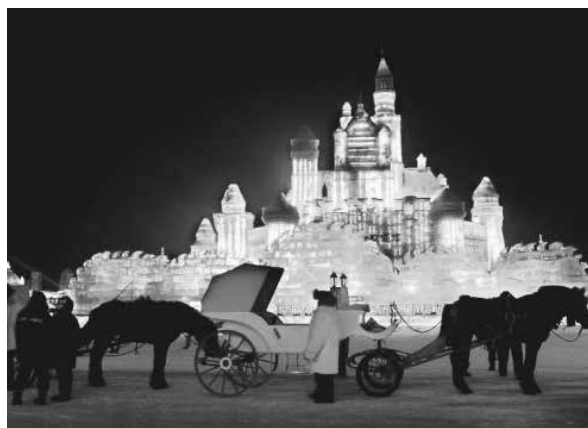
写真2 ハルビンの「冰雪大世界」