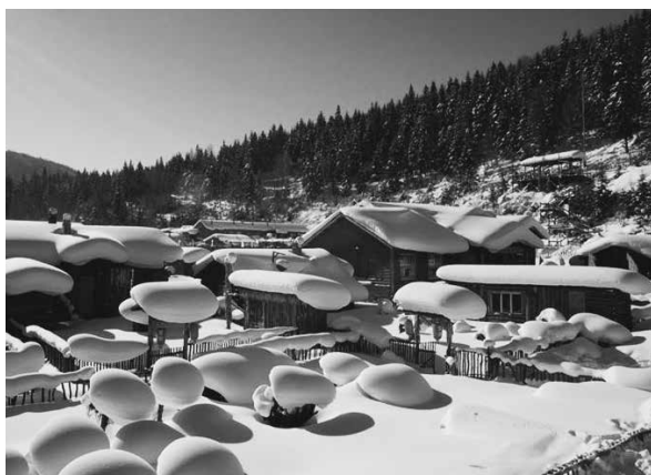
写真1 牡丹江の「雪郷」