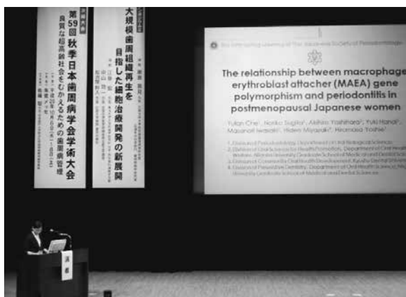
写真3 平成28年度日本歯周病学会で発表している様子