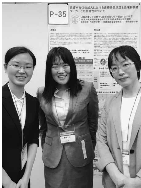
写真4 第59回日本歯周病学会2016年度春季学術大会で杉田班

最後に、日頃から指導してくれる先生方にこの場を借りて心より厚く御礼申し上げます。本当にありがとうございました。