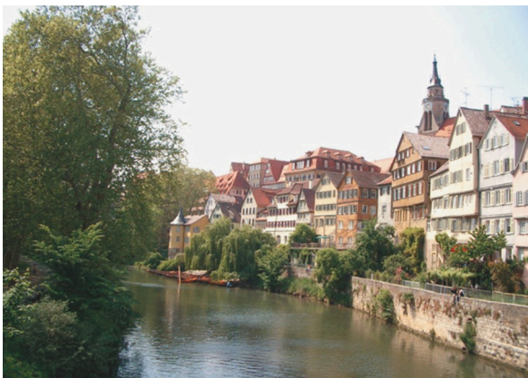
図 1 ネッカー橋からの眺め

そしてスタッフが充実している点。ここには常在の歯科衛生士が 10 人近く、そして実習生が数名おり、インプラント手術準備、後片付け、手術介助、器具管理、滅菌、次回の予約業務、メンテ