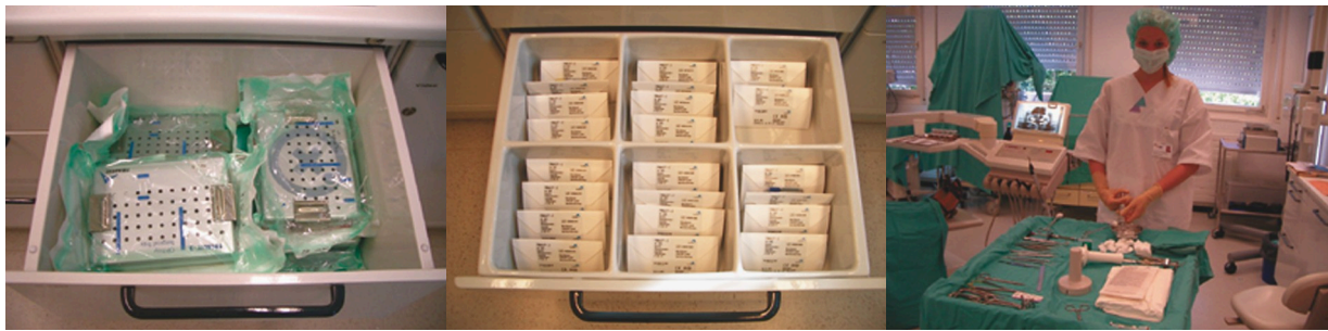
図3 豊富な予備材料とスタンバイの様子。患者さん&ドクター待ちです