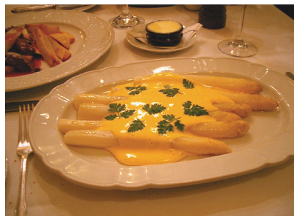
図5 とても大きく太く、堂々たるメインディッシュです