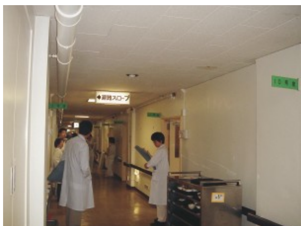
12月30日、旧歯科病室から東病棟3階の新歯科／口腔外科病棟に移転