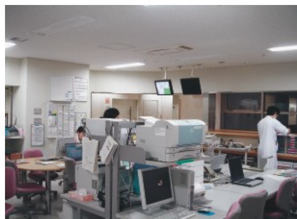
ナースステーション：歯科医師と看護師が使用。患者監視装置、他の機能が集中