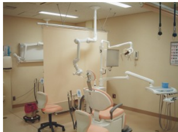
処置室：ユニット4台。外付けバキューム装置、ユニット間の遮蔽カーテンを装備