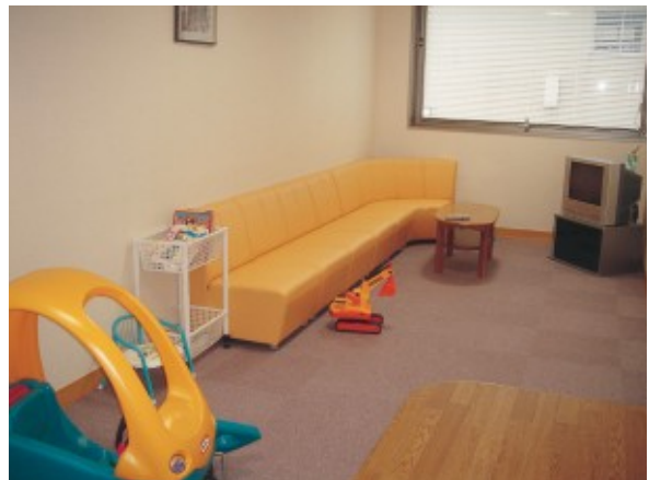
患者様のアメニティー面の充実：食堂(左)と子供用プレールーム(右)