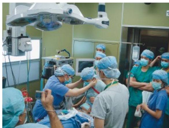
12月28日、新手術室シミュレーション