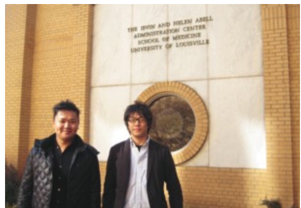
ルイビル大学前で