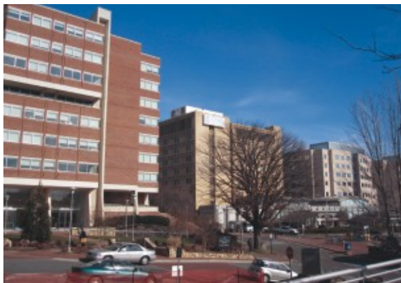
ノースカロライナ大学歯学部（左建物）と医学部附属病院（中央）

の大学院制度は異なっているものの、今回のノースカロライナ大学のプログラムは、複数の研究室をローテーションすることや、その評価方法は実質化を行う上で大変参考になるものでした。また、大学全体として大学院教育に取り組む（歯科は独立していましたが）ことの利点・欠点を知ることができ、総合大学である新潟大学全体として大学院教育を考えることの必要性も感じた次第です。