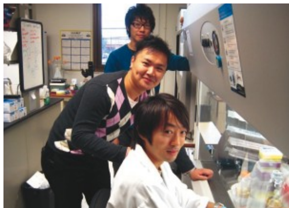
土門先生と研究室にて