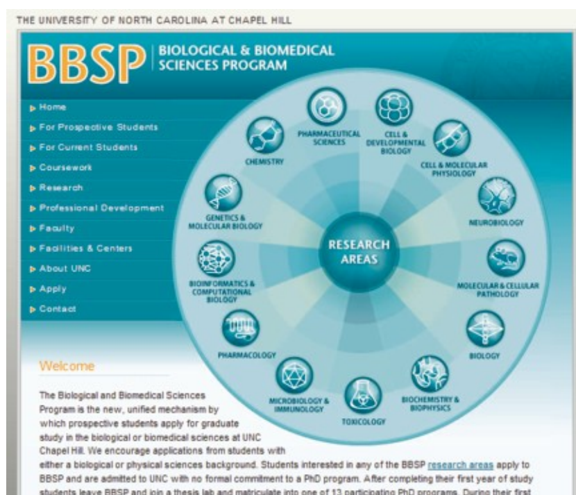
図 アンブレラプログラム ( http://www.med.unc.edu/bbsp/welcome.html )

また、医学部と同様に歯科医師免許とPh.D.の学位を同時に取得しようとするDDS/Ph.D.プログラムも提供されています。しかし現状では、学生が臨床での学習と研究活動の両立を図ること