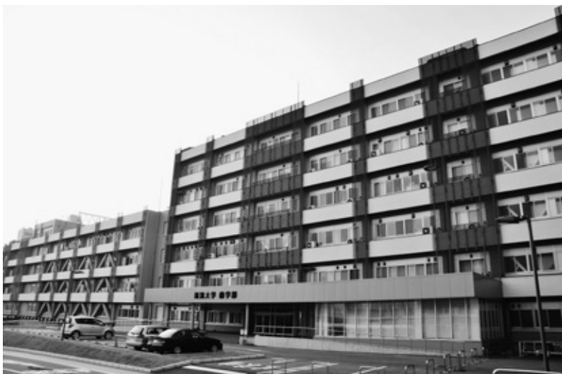
歯学部正面玄関 平成28年