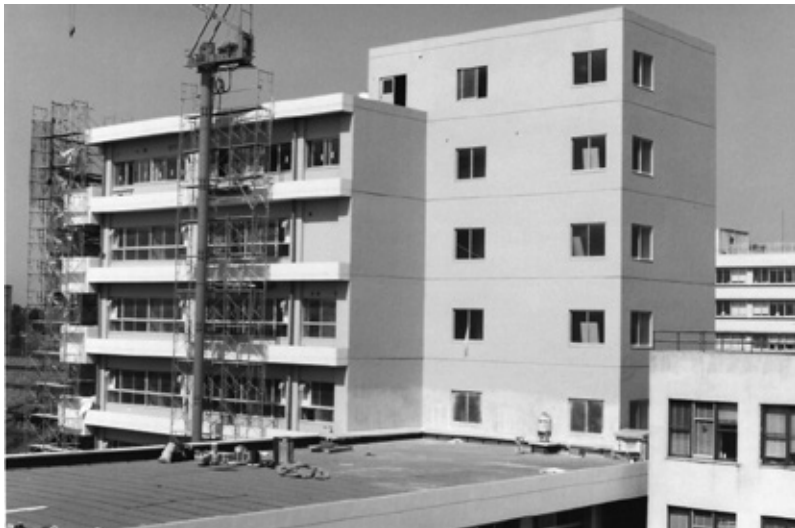
歯学部A棟建設中 昭和55年頃