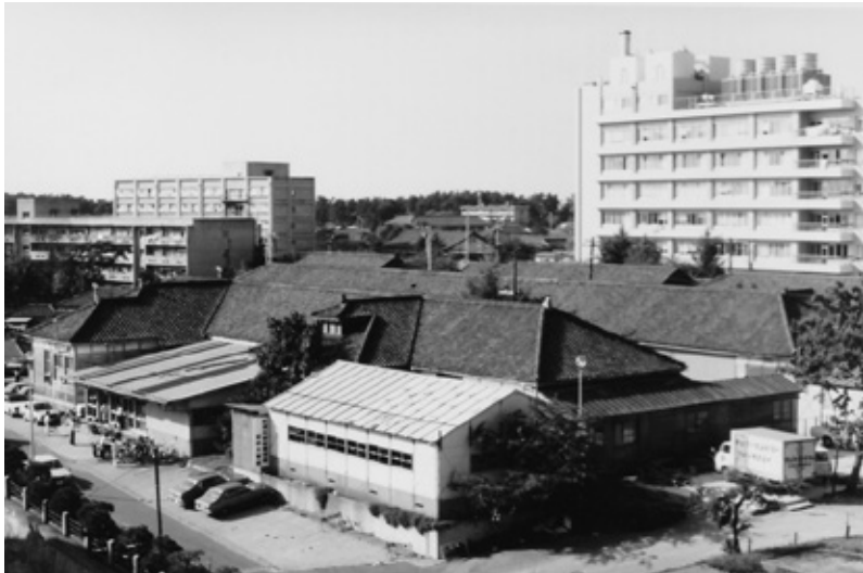
歯学部創立時全景 昭和43年頃